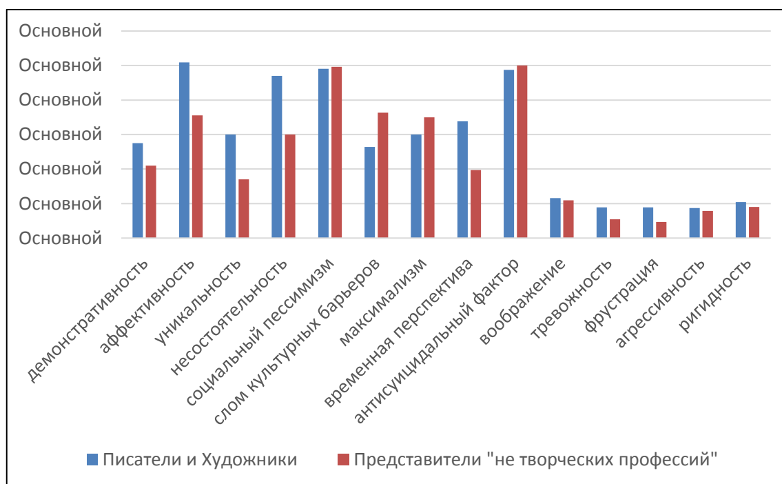
Рис. 2. Соотношение показателей личностных характеристик представителей творческих и «не творческих» профессий

В ходе сравнительного анализа измеряемых параметров личности представителей творческих профессий (писателей и графических художников) и «не творческих», также выполненного по U-критерию Манна-Уитни, установлены следующие статистически значимые различия: